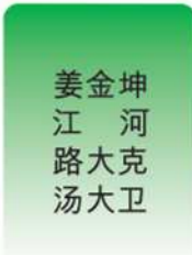
姜金坤 江河路 大克 汤大卫