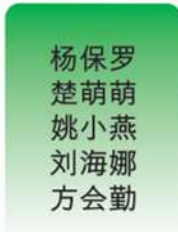
杨保罗 楚萌萌 姚小燕 刘海娜 方会勤