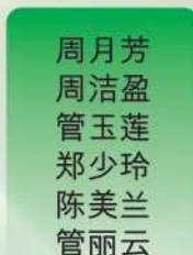
周月芳 周洁盈 管玉莲 郑少玲 陈美兰 管丽云