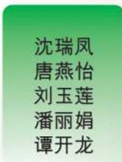
沈瑞凤 唐燕怡 刘玉莲 潘丽娟 谭开龙