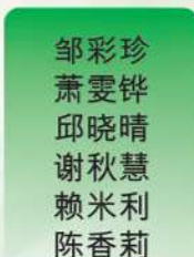
邹彩珍 萧雯铎 邱晓晴 谢秋慧 赖米利 陈香莉