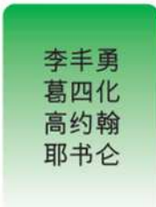
李丰勇 葛四化 高约翰 耶书仑