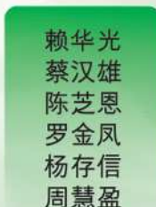
赖华光 蔡汉雄 陈芝恩 罗金凤 杨存信 周慧盈