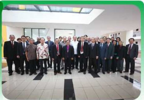
▲主礼团、董事、讲师合照