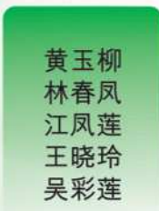
黄玉柳 林春风 江凤莲 王晓玲 吴彩莲