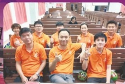
安顺卫理公会神学之夜