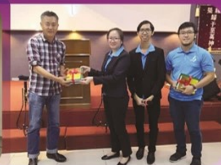
峇株巴辖荣耀教会