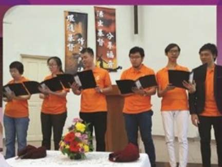
皇后圣道基督教会