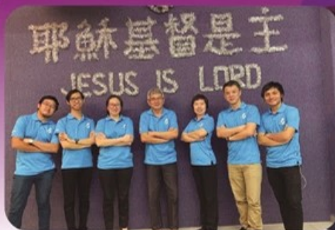
南马3月份毕业小组