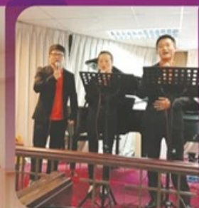
怡保主恩堂 神学主日献唱