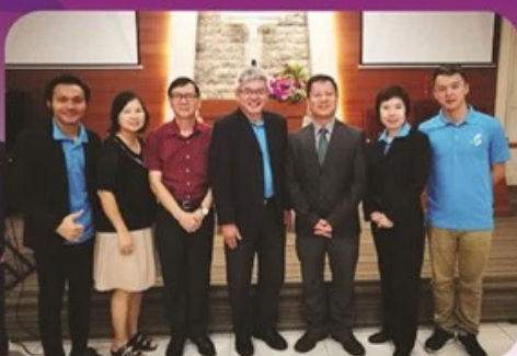
长老会苏雅喜乐堂