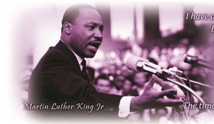
Martin Luther King Jr.

路德金Jr也说过：I have a dream, one dream, keep dreaming. Dream of freedom, justice dreaming, dreaming of equality and hopefully no longer