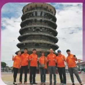
北马6月份毕业小组

最后，感谢神让我们毕业班同学有机会同心配搭服事。三天两夜的朝夕相见，一起享受美食，共同分享在河畔上的第一道阳光，这是一次美好的团契记忆。盼望毕业之后，无论身处何方，因基督的爱我们得以继续联系在一起。